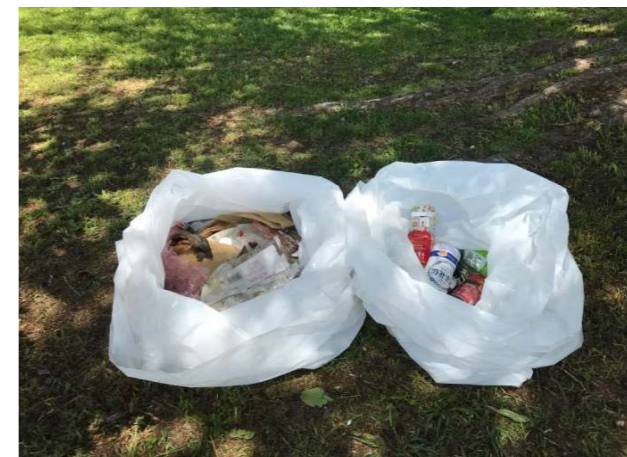
【 屯田バンビ公園 】