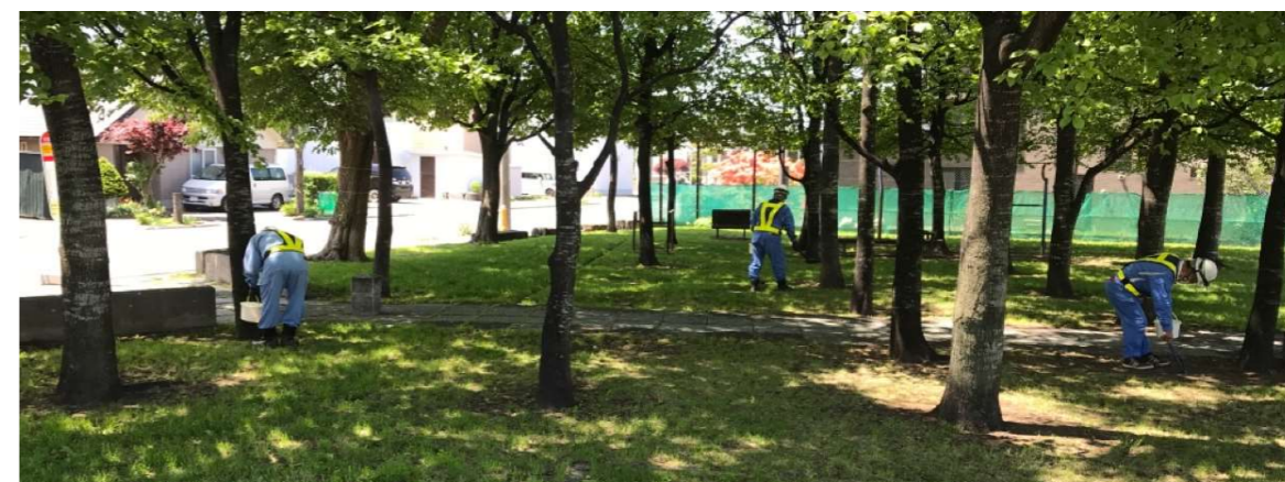
【 屯田南緑地公園 】