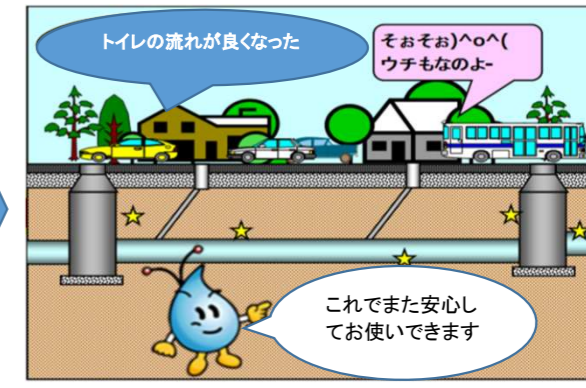
管更生施工後の下水道管