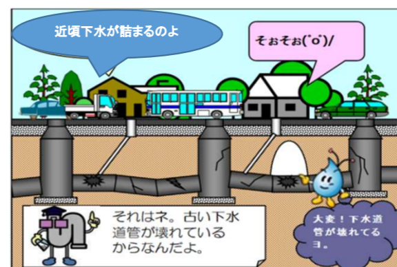
施工前の既設下水道管内